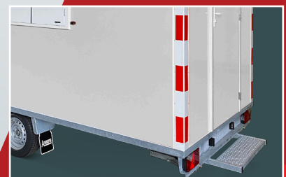
Stalen opstap met gripprofiel