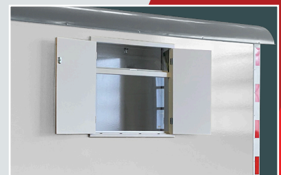
Raam met ventilatiestand